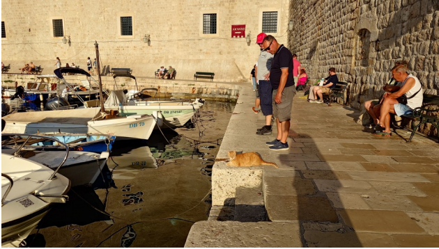
Kroatische Katzen in Dubrovnik ...