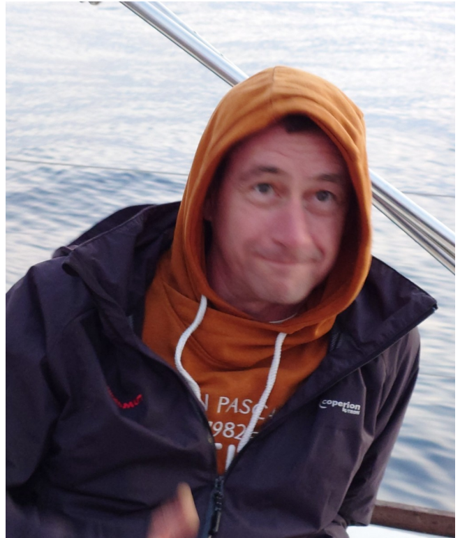
Der B-Schein Aspirant am frühen Morgen