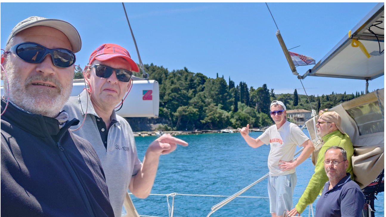
Die vereinigten Crews auf einem Boot – Dubrovnik empfängt uns ...