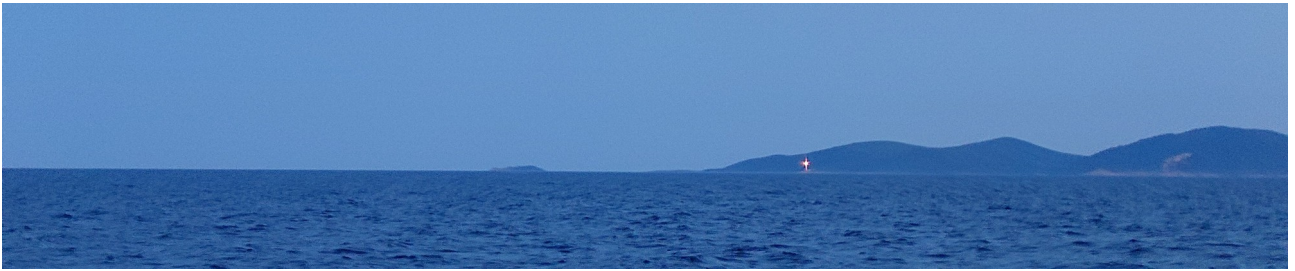
Ein Leuchfeuer in der Inselwelt Kroatiens