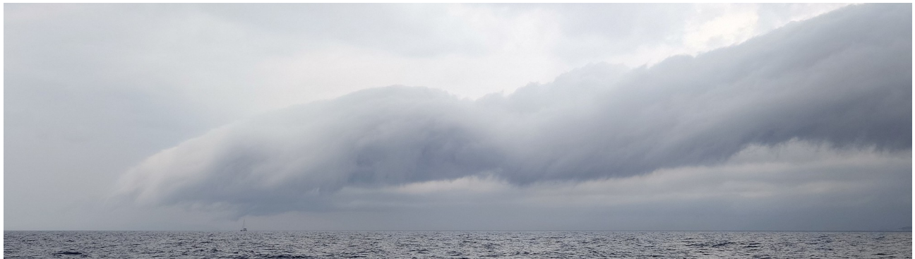
Ein Segler vor dem Gewitter ... als würde die Wolke das Schiff abtasten wollen ...